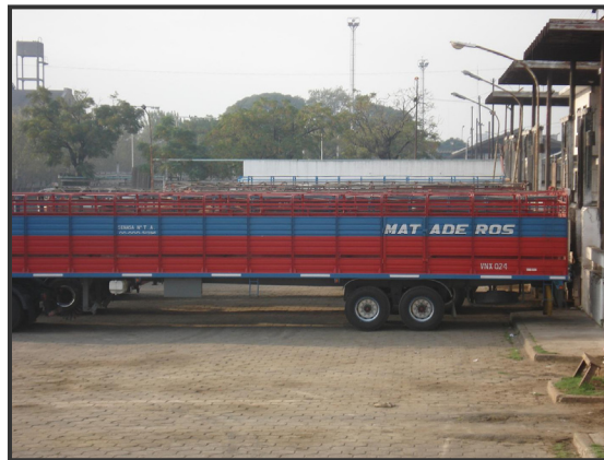
Atraque del camión con el embarcadero