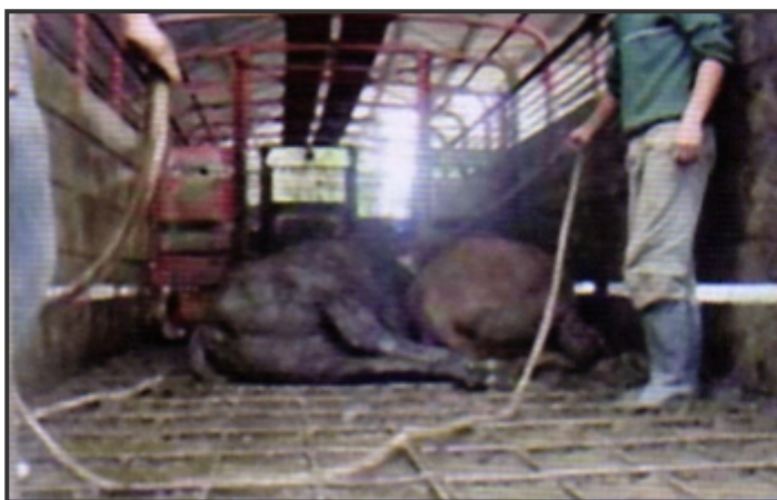
Figura 1: Vaca caída

Las evidencias del maltrato sufrido durante el transporte pueden ser altamente notorias externamente (ejemplo: animal caído en el camión-Figura 1-) o bien ser evidenciadas en las lesiones de las canales halladas en la playa de faena (Figuras 3, 4 y 5)