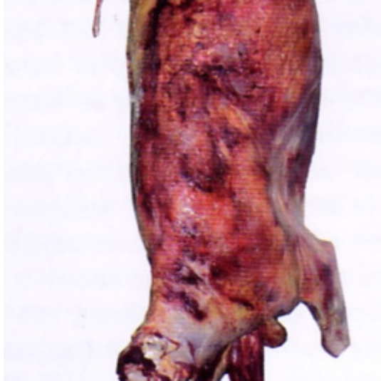
Figura 4: Contusión generalizada (animal caído durante el transporte).